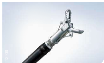
Coagrasper G FD-412LR